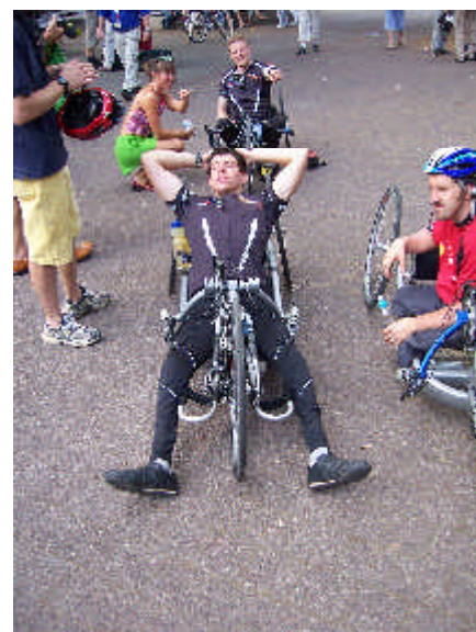
Ankunft in Karlsruhe

35 km/h und zeitweise über 45 km/h im vorderen Feld mitnichten sofort abzuschütteln, sondern hielt im Penelton die ersten 35 km tapfer mit. Dann forderten die Anstiege ihren Tribut , man musste die Radfahrer ziehen lassen – und jetzt wurde es erst richtig hart. Kein Windschatten, kein Ende in Sicht und die Arme wurden langsam müde ...Aufgeben , war klar, kam nicht in Frage und nach 10 Stunden in zuletzt sengender Sonne war der Kampf gewonnen und das Ziel unter dem Beifall der Radler erreicht !! Meisterleistung !!