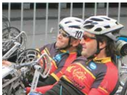
Team-Training macht Spaß

Wer fit in die Handbike Saison starten will, dem bietet das Handbiker Trainingslager des Teams Rehabilitation im März 2005 die optimale Saisonvorbereitung. Gemeinsam trainieren macht mehr Spaß, die im Winter etwas eingestoreten Muskeln werden