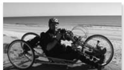
Trainingswoche Portugal Handbike Saisonvorbereitung an der Algarveküste